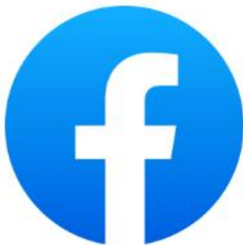
Facebook : โรงเรียนบ้านโพน ศรีสะเกษ