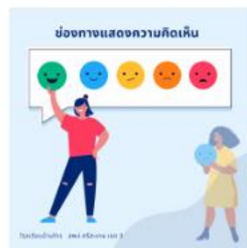
รับฟังความคิดเห็น