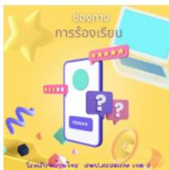
ช่องทางเรื่องร้องเรียน